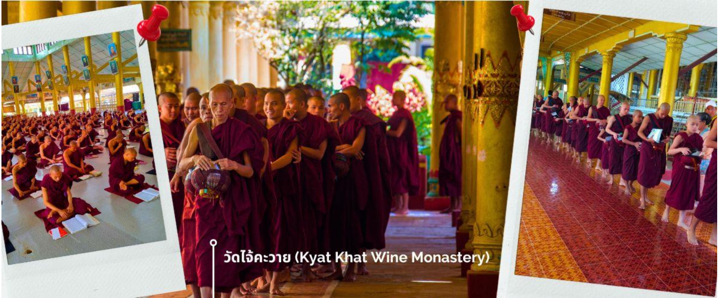
วัดไจ้คะวาย (Kyat Khat Wine Monastery)

นำท่านเดินทางลงจากพระธาตุนันทร์แขวน โดยใช้เส้นทางเดิม เพื่อมุ่งหน้าสู่เมืองหงสาวดี (ใช้เวลาเดินทางประมาณ 1 ชั่วโมง 30 นาที) เชิญร่วมทำบุญตักบาตรพระสงฆ์ ณ วัดไจ้คะวาย เมืองหงสาวดี มีพระสงฆ์กว่า 1000 รูป เป็นโรงเรียนสอนพระพุทธศาสนา นักรธรรมชั้นตรี โท และ เอก เพื่อศึกษาพระไตรปิฎกเป็นจำนวนมาก ในช่วงสายของทุกวัน พระสงฆ์และเณร จะเดินออกมาบิณฑบาตเพื่อเตรียมฉันเพล โดยวัดแห่งนี้ ได้รับการสนับสนุนจากชาวพุทธในพม่าเองและ นักท่องเที่ยวที่เดินทางมาที่วัด เพื่อทำการถวายเงินปัจจัย หรือ ข้าวสาร รวมไปถึง อุปกรณ์การเรียนและเครื่องเขียนต่างๆ เพื่อใช้ในการ ศึกษาธรรมะของพระสงฆ์และเณรในวัดไจ้คะวายแห่งนี้