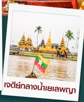
เจดีย์กลางน้ำเยเลพญา