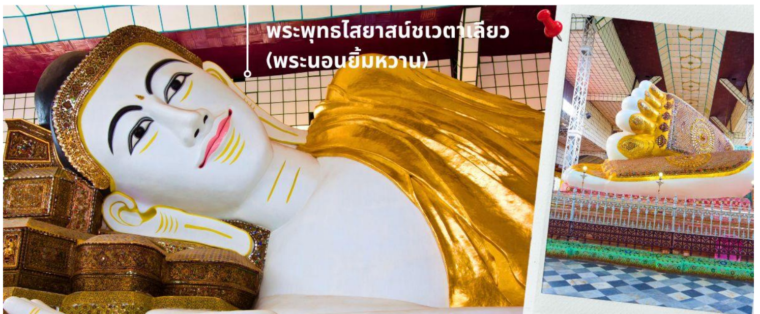
พระพุทธรไสยาสน์ชเวตาเลียว (พระนอนยี่มหวาน)

พระพุทธรไสยาสน์ชเวตาเลียว เป็นปูชนียสถานศักดิ์สิทธิ์อันดับสองของเมืองหงสาวดี รองจากมหาเจดีย์มูเตา หรือที่คนไทยรู้จักกันในชื่อ "พระนอนยี่มหวาน" พระนอนชเวตาเลียว หรือ พระพุทธรไสยาสน์ชเวตาเลียว มีอายุเก่าแก่กว่า ๑,๒๐๐ ปี คนไทยรู้จักในนาม พระนอนยี่มหวาน เนื่องจากพระพักตร์ของท่านได้รับการวาดตกแต่งไว้อย่างสวยงามพร้อมด้วยรอยยี่มหวาน องค์พระเป็นศิลปะแบบมอญท่านสามารถที่จะเลือกหา เครื่องไม้แกะสลัก ที่มีให้เลือกมากมาย ตลอดจนสองข้างทางที่จะเดินเข้าไปสักการะองค์พระนอน และสินค้าพื้นเมืองอื่นๆ อาทิเช่น ผ้าพม่า ของที่ระลึกต่างๆอีกมากมาย