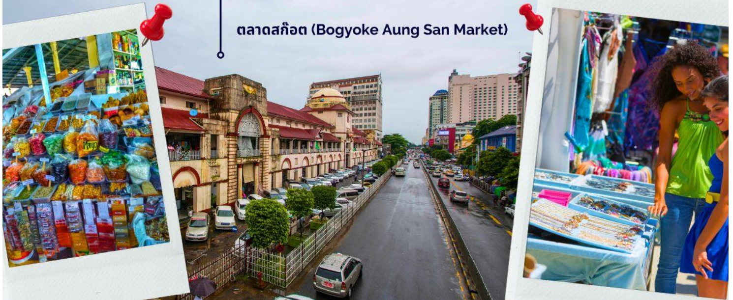
ตลาดสก๊อต (Bogyoke Aung San Market)

ให้ท่านได้มีเวลากับการเลือกซื้อของฝาก ของที่ระลึกต่างๆ ทั้งสินค้าพื้นเมืองที่มีชื่อเสียงของพม่าที่ ตลาดสก๊อต (Bogyoke Aung San Market) นี่คือนตลาดที่ใหญ่ที่สุดในย่างกุ้ง เป็นแหล่งช้อปปิ้งที่มีสินค้าวางขายแทบทุกชนิด เปรียบเสมือนตลาดนัดจตุจักรของบ้านเราก็คงได้ นอกจากสินค้าพื้นเมืองแล้ว ตลาดแห่งนี้ยังเป็นแหล่งรวมสินค้าประเภทอัญมณีที่เป็นที่รู้จักไปทั่วโลกนั่นคือ หยกพม่า (หากซื้อสินค้าหรืออัญมณีที่มีราคาสูง ควรขอใบเสร็จรับเงินทุกครั้ง เนื่องจากจะต้องแสดงให้เห็นเจ้าหน้าที่ศุลกากรหากมีการขอตรวจสอบ)