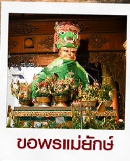
ขอพรแม่ย่า