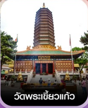
วัดพระเขี้ยวแก้ว