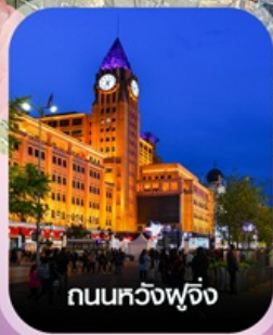
ถนนหวังฟู่จิ้ง

✈️ คอนเฟิร์มออกเดินทาง ทุกพีเรียด 2 ท่านขึ้นไป