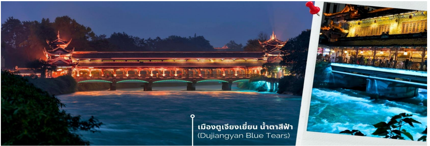
เมืองตงเจียงเยียน น้ำตาสีฟ้า (Dujiangyan Blue Tears)

นำท่านเดินทางสู่ เมืองโบราณตงเจียงเยียน เมืองนี้เป็นแหล่งโครงการชลประทานต้นแบบสมัยโบราณที่มีประวัติยาวนานมากกว่า 2,274 ปี ตั้งอยู่ในมณฑลเสฉวน เพื่อแก้ปัญหาน้ำท่วมในพื้นที่ลุ่มแม่น้ำ Minjiang และเพื่อจัดสรรน้ำสำหรับการเกษตรนี้ โดยการสร้างควบคุมน้ำที่ไม่ต้องพึ่งพาเขื่อนชลประทานนี้ยังคงใช้งานได้ดีจนถึงปัจจุบันและได้รับการยกย่องให้เป็นหนึ่งในมรดกโลกโดยองค์การยูเนสโก และยังเป็นต้นแบบของภูมิปัญญาด้านการจัดการทรัพยากรน้ำของจีน ไม่เพียงแต่ได้รับการ ยกย่องในด้านวิศวกรรมอันชาญฉลาดและประโยชน์ต่อระบบนิเวศเท่านั้นแต่ยังเป็นที่ยอมรับในฐานะสถานที่ชมความงามของปรากฏการณ์ “น้ำตาสีฟ้า” ที่ตราตรึงใจนักท่องเที่ยวทั่วโลก ให้ท่านเข้าชม ธารน้ำสีฟ้า Blue Tears เป็นจุดท่องเที่ยวที่เต็มไปด้วยมนต์เสน่ห์แห่งสถาปัตยกรรมจีนแบบดั้งเดิม ทอดยาวข้ามแม่น้ำ กลายเป็นภาพอันน่าประทับใจยามค่ำคืนเมื่อแสงไฟตกแต่งส่องสะท้อนน้ำให้กลายเป็นสีฟ้าเงิน ดูสวยงามราวกับโลกแห่งจินตนาการ ความพิเศษอยู่ที่การจัดไฟอย่างประณีต ซึ่งช่วยเน้นให้สะพานมีชีวิตชีวาท่ามกลางบรรยากาศยามค่ำคืนที่รายรอบไปด้วยภูเขาและต้นไม้เพิ่มความรู้สึกสงบและสดชื่น เมื่อเดินข้ามสะพานนี้แล้วได้สัมผัสกับบรรยากาศรอบๆ มีแสงไฟที่ส่องประกายลงสู่ผืนน้ำจึงเป็นประสบการณ์ที่ทำให้รู้สึกผ่อนคลายและเต็มไปด้วยความประทับใจที่ยากจะลืม