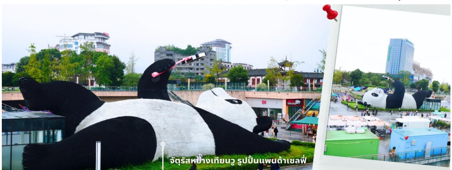
จัตุรัสหย่างเทียนวู รูปปั้นแพนด้าเซลฟี่

นำท่านเที่ยวชม จัตุรัสหย่างเทียนวู เป็นจุดเช็คอินที่สำคัญสำหรับคนที่มาเที่ยวที่ เมืองตูเจียงเยียน บริเวณจุดตัดท่าข้ามอำเภอตูเจียงเยียน นครเฉิงตู ไฮไลท์ของจัตุรัสหย่างเทียนวู คือ ประติมากรรม แพนด้ายักษ์ที่กำลังนอนหงายท้อง ยืนมีมือถือไม้เซลฟี่สีชมพู ซึ่งออกแบบโดยนักออกแบบชื่อดัง Florentijn Hofman รูปปั้นแพนด้า ยักษ์มีความยาว 26 เมตร กว้าง 11 เมตร สูง 12 เมตร และหนัก 130 ตัน แบบท่าทางสบายๆของแพนด้าที่ความประทับใจและรอยยิ้มให้กับผู้ที่มาเยือนจัตุรัสหย่างเทียนวู สามารถดึงดูดนักท่องเที่ยวได้เป็นจำนวนมากเลยทีเดียว เป็นการแสดงออกด้วยภาษาทางศิลปะแบบหนึ่งที่สะท้อนชีวิตในท้องถิ่น มอบความรู้สึกลึกลับสนทนสนมและมีความสุขกับผู้ชม อิสระเดินชมถ่ายภาพ รูปปั้นแพนด้าเซลฟี่ ตามอัยาศัย ที่นึ่งเป็นจุดเช็คอินที่เหมาะสมสำหรับทุกเพศทุกวัย หากคุณกำลังมองหาสถานที่ท่องเที่ยวใหม่ๆ ที่เต็มไปด้วย ความทรงจำดีๆ จตุรัสหย่างเทียนวอ คือคำตอบที่สมบูรณ์แบบ