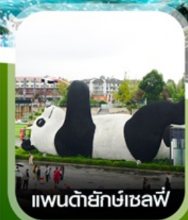
แพนด้ายักษ์เซลฟี่

✈️ คอนเฟิร์ม ออกเดินทาง ทุกพีเรียด 2 ท่านขึ้นไป