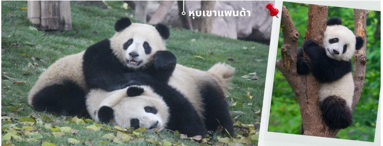
หุบเขาแพนด้า

หุบเขาแพนด้า หุบเขาหมีแพนด้าตั้งอยู่ในหมู่บ้านไปหมาของเมืองตูเจียงเยียนห่างจากตัวเมืองเฉิงตูประมาณ 50 กิโลเมตร ถือเป็นอีกหนึ่งสาขาของฐานการวิจัยการพัฒนแพนด้ายักษ์ของนครเฉิงตู เพื่อช่วยให้หมีแพนด้าที่ถูกเลี้ยงดูและอยู่ในความดูแลของมนุษย์ สามารถปรับตัวในหุบเขาหมีแพนด้า ซึ่งมีสภาพแวดล้อมธรรมชาติที่เหมือนป่าจริงๆ แล้วหลังจากนั้นจะปล่อยหมีแพนด้าให้เข้าสู่ป่าและใช้ชีวิตในป่าได้จริง