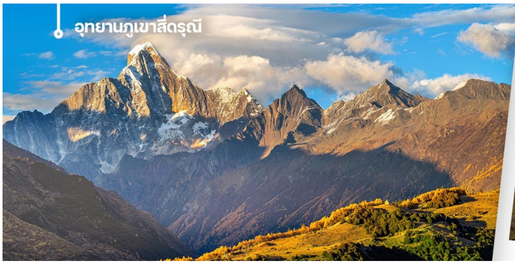
อุทยานภูเขาสิ่วรุณี