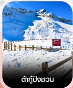
ต้ากู่ปิงชอน