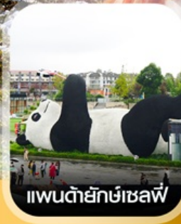
แพนด้ายักษ์เซลฟ์

คอนเฟิร์มออกเดินทาง ทุกพีเรียด 2 ท่านขึ้นไป