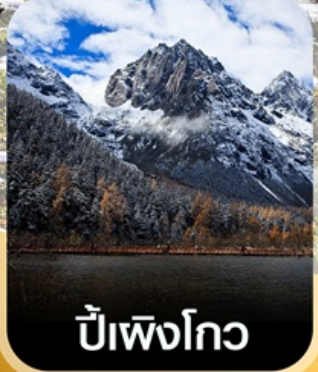
ปี๋เผิงโกว