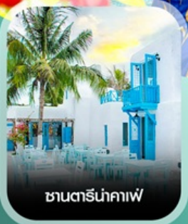
ซานตริ่นาคาเฟ่

คอนเฟิร์มออกเดินทาง ทุกพีเรียด 2 ท่านขึ้นไป