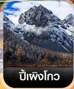
ปี๋เผิงโกว

✈️ คอนเฟิร์มออกเดินทาง ทุกพีเรียด 2 ท่านขึ้นไป ✈️