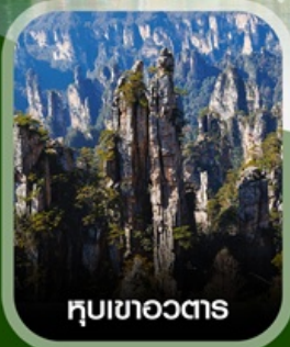
hubเขาอวตาร

ฟรี ใส่ชุดชนเผ่าท้องถิ่น บัตรตรงลงจางเจียเจีย