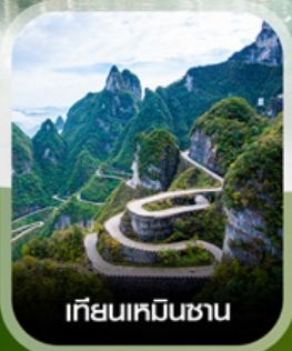
เทียนเหมินชาน

✈️ คอนเฟิร์มออกเดินทาง ทุกพีเรียด 2 ท่านขึ้นไป