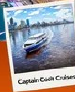
Captain Cook Cruises