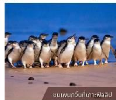
ชมเพนกวินที่เกาะฟิลลิป