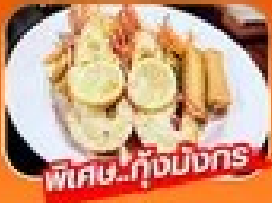
พิเศษ! กุ้งมังกร