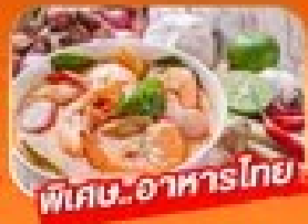
พิเศษ! อาหารไทย