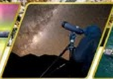
กิจกรรมชมทิวทัศน์ดาว