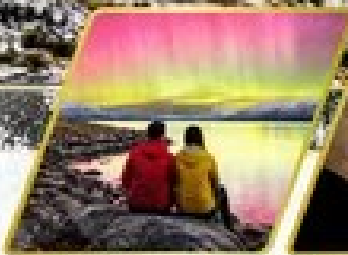
ตามล่าหาแสงใต้