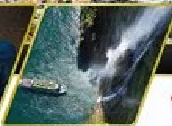
ล่องเรือมิลฟอร์ด ซาวน์