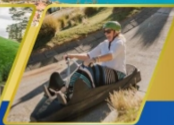
เล่นลู่ที่ควีนส์ทาวน์

AUCKLAND / ROTORUA / CHRISTCHURCH FOX GLACIER / FRANZ JOSEF / QUEENSTOWN