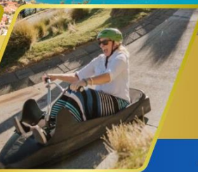
เล่นลู่ ที่ควีนส์ทาวน์

✈️ บินภายใน (เที่ยวสุดคุ้ม) พักโรงแรม 4 ดาว ★★★★★