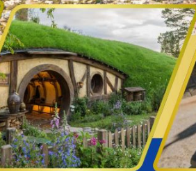
หมู่บ้านฮ็อบบิต