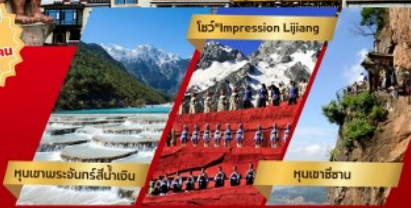
หุบเขาพระจันทร์สีน้ำเงิน