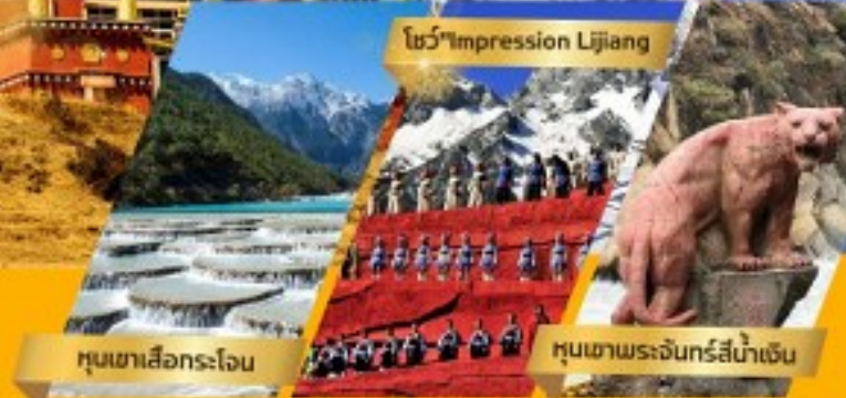
โชว์ "Impression Lijiang"