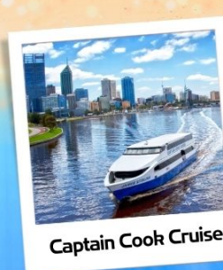
Captain Cook Cruises

เพิร์ธ ชมเมือง - สวนสาธารณะคิงส์พาร์ค - ล่องเรือแม่น้ำสวอน พรีแมนเทิล - เกี่ยวป่าหินพินนาเคิล ณ อุทยานแห่งชาติเนมบุง 4WD ตะลุยเนินทราย - สวนสัตว์พื้นเมือง ชิมไวน์ Sandalford Winery - โรงงานช็อคโกแลต