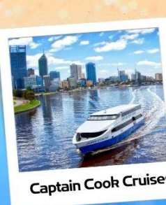
Captain Cook Cruises