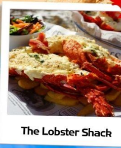
The Lobster Shack