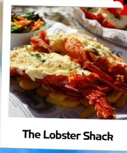
The Lobster Shack