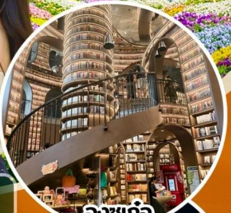
จงซูเก๋อ