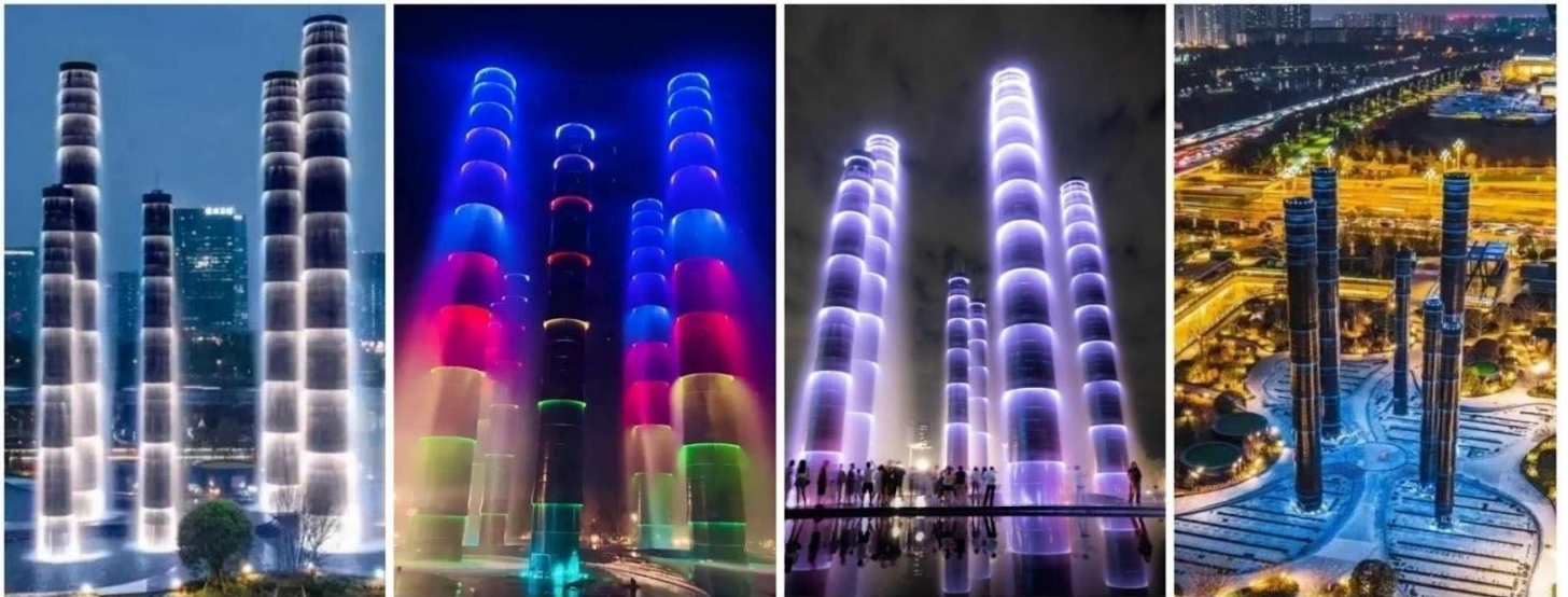
ชมแสงสี The Tower of Life

จากนั้นพาท่านไป ช้อปปิ้งที่ห้างหรู SKP แลนด์มาร์คที่ล้ำสมัยที่สุดในเมืองเฉิงตูเวลานี้ ห้างสรรพสินค้าลึกลับที่มิได้แค่ขายของแบรนด์เนมแต่คือการปฏิวัติวงการสถาปัตยกรรมด้วยคอนเซ็ปต์สวนสาธารณะบนดิน ห้างหรูใต้ดิน" บนพื้นที่รวมกว่า 5 แสนตารางเมตร ความพิเศษที่ทำให้ Chengdu SKP แตกต่างจากที่อื่นคือการสร้างห้างลึกลงไปใต้ดินถึง 5 ชั้น โดยที่พื้นที่ระดับพื้นดินถูกเปลี่ยนเป็นสวนสาธารณะสีเขียวขนาดใหญ่