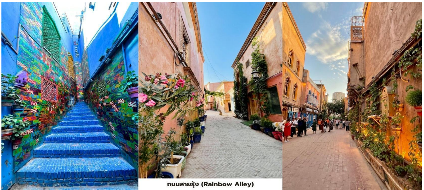
ถนนสายรุ้ง (Rainbow Alley)

นำท่านแวะชม ย่านศิลปะ ที่มีชื่อเสียงของเมืองคัชการ์ในปัจจุบัน ถนนสายรุ้ง (Rainbow Alley) เป็นซอยแคบที่บ้านเรือนที่ถูกทาสีสดใสหลากหลายสีจนกลายเป็นจุดถ่ายภาพยอดนิยมที่นักท่องเที่ยวสามารถมาเก็บภาพความสวยงามได้ทุกมุม ถนนภาพวาดน้ำมัน (Oil Painting Street) เป็นย่านแกลเลอรีของศิลปินท้องถิ่นที่จัดแสดงและจำหน่ายภาพวาดเกี่ยวกับภูมิทัศน์และวัฒนธรรมของซินเจียง นอกจากนี้นักท่องเที่ยวยังสามารถเลือกซื้อของที่ระลึกและงานหัตถกรรมพื้นเมืองภาพวาดน้ำมันต้นฉบับงานหัตถกรรมอุยกูร์แฮนด์เมด ไปสการ์ตภาพทิวทัศน์เมืองคัช