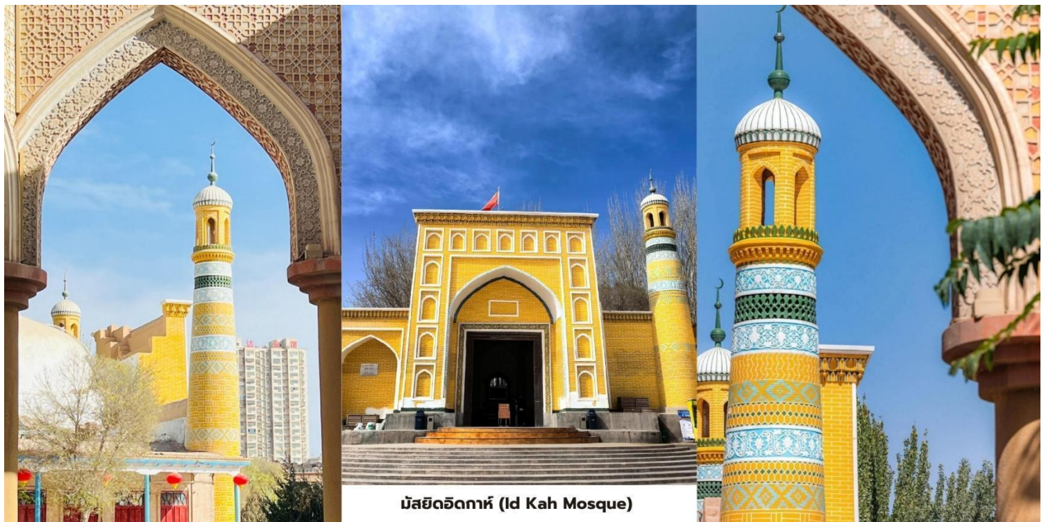
มัสยิดอิตก้าห์ (Id Kah Mosque)

สมควรแก่เวลานำท่านเดินทางสู่สนามบินคัชการ์ (Kashgar Airport) ภายในประเทศสู่เมืองหลานโจว