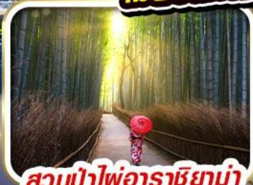
สวนป่าไฟอาราชิยาม่า

อิสระเต็มวัน เลือกซื้อแพ็คเกจ! - UNIVERSAL STUDIO JAPAN