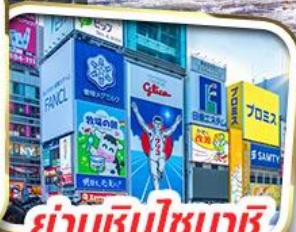
ย่านชินไซบาชิ

ราคาเริ่มต้น 29,999 *รวมภาษีมูลค่าเพิ่มแล้ว*