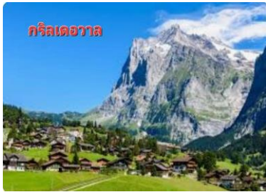
กรินเดอร์วัลล์

เช้า รับประทานอาหารเช้า ณ ห้องอาหารโรงแรม