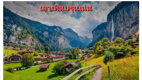
เลาเทินบรุนเน่น

บ่าย จากนั้นอิสระให้ท่านมีเวลาอย่างเต็มที่ที่จะเก็บภาพที่ระลึกบนลานกว้างที่เต็มไปด้วยหิมะชาวโพลนให้ท่านได้สนุกสนานอย่างเต็มอิม จนถึงเวลาอันสมควร จึงนำท่านเดินทางกลับโดยใช้เส้นทางที่สวยแสนโรแมนติกอีกเส้นทางหนึ่ง โดยการนั่งรถไฟชมวิวกว๊าทซ์เคิร์นอีกฝั่งสู่ เมืองเลเทียร์ นบรุนเน่น (LAUTER BRUNNEN) ...เดินทางถึงเมืองลูเซิร์น