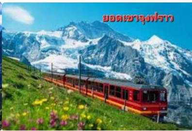
ยอดเขาจุงฟราว

จากนั้นนำท่านเดินทางสู่ สถานีกรินเดอร์วัลล์ เพื่อพาท่านนั่งกระเช้าไอเกอร์เอ็กซ์เพรส (EIGER EXPRESS) ขึ้นสู่สถานี EIGERGLETCHER ด้วยเวลาเพียง 15 นาที และต่อด้วยรถไฟขึ้นสู่ยอดเขาจุงฟราวน์ TOP OF EUROPE เมื่อถึงยอดเขาแล้วท่านจะได้สัมผัสกับทัศนียภาพอันงดงาม