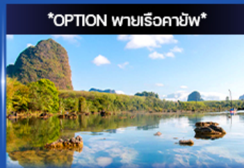
คลองहरुด (คลองน้ำใส)