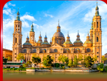
มหาวิหารแม่พระแห่งเสาคัสดีลิกรี่