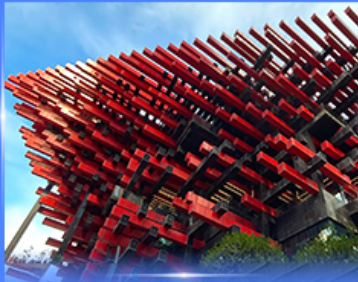
แลนด์มาร์คดัง ตึกตะเกียบ