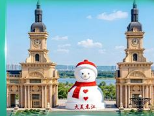
ตุ๊กตาหิมะยักษ์ ฮาร์บิน