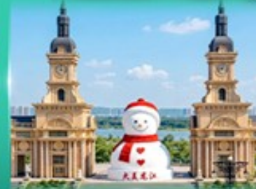
ตึกตาศิมะยักซ์ ฮาร์บิน