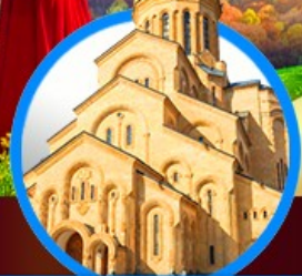
โบสถ์กรินดี เมืองทบิลีซี