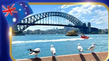
เข็คอินสะพานซิดนีย์ฮาร์เบอร์