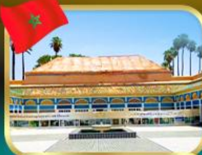
พระราชวังบาเฮีย