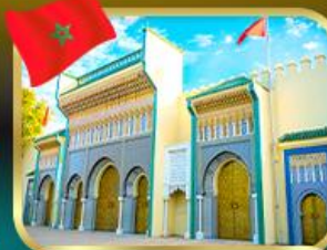
ประตูพระราชวังหลวง