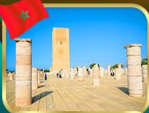
หอคอยฮัสซัน ราบัต