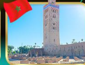
มัสยิดคูตูเบีย มาราเกช