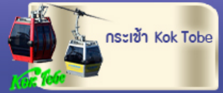
กระเช้า Kok Tobe