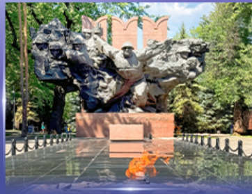
สวนสาธารณะ 28 Panfilov Park