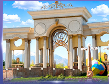
สวนสาธารณะประธานาธิบดี