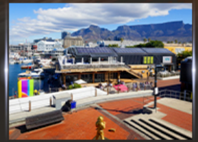
ท่าเรือ V&A waterfront