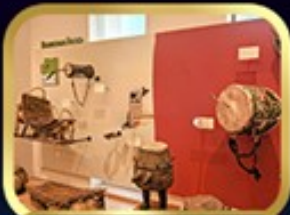
Museum of Folk Instrument