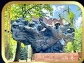
Panfilov Guardsmen Park