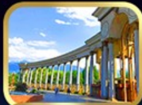
1st President Park