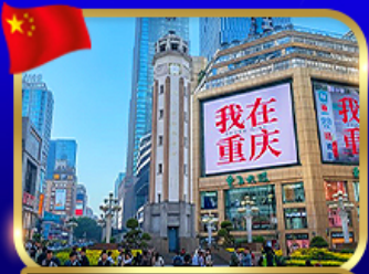
ถนนคนเดินริยฝางเปย์