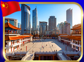
ตึกไค่ว์ซิงโหล