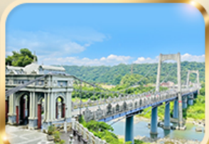
สะพานต้าซี เกาหยวน