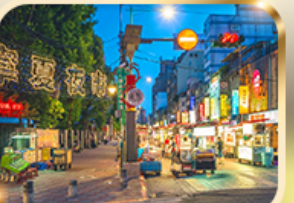
หนิงเซี่ย ไนท์มาร์เก็ต