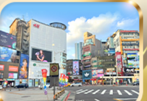
ช้อปปิ้งย่านซีเหมินติง