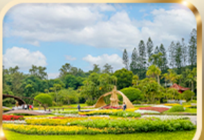
สวนบ้านปรน.เจียงไคเช็ค