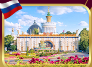
สวนสาธารณะ VDNKH