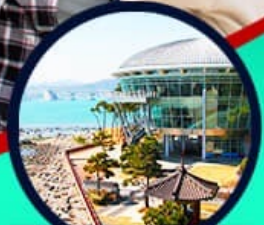
เอเปคเฮาส์ บูริมารู