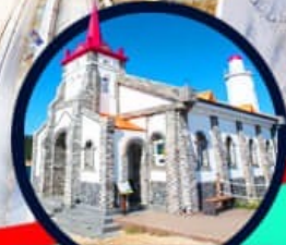
โบสถ์คริสต์จุกซอง