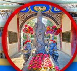
เจ้าแม่กวนอิมต้าลี่