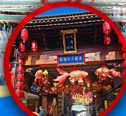
เมืองโบราณต้าลี่