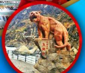
ช่องเขาเสือกระโจน