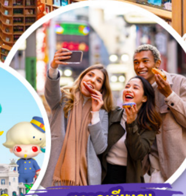
ตลาดเมียงดง