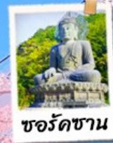
ชอริคซาน