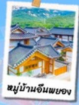
หมู่บ้านอินเพยอง