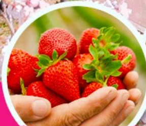
ไร่สตรอว์เบอร์รี่