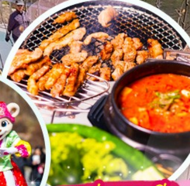
เมนูย่างเกาหลี