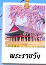
พระราชวัง