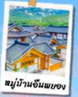
หมู่บ้านฮันพยอง