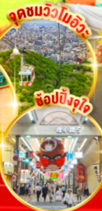
จุดชมวิวมะลิ