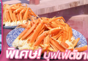
พิเศษ! บุฟเฟ่ต์ซาซิมิ