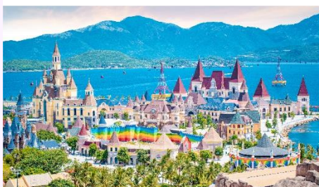
VinWonders NHA TRANG