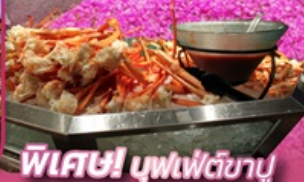
พิเศษ! นุฟเพ็ตชิยาปู