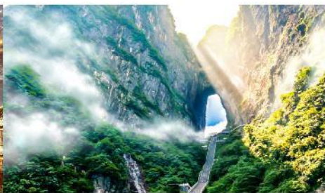
ประตูสวรรค์