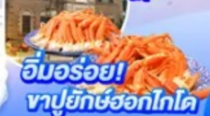
อิมมอร์ทัล! ทาปูยักษ์ฮอกไกโด