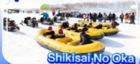
Shikisai No Oka