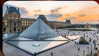
เข้าชมพิพิธภัณฑ์ลูฟวร์