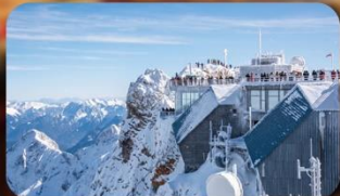
พีชิต Zugspitze Top Of Germany