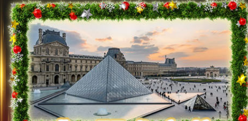
เข้าชมพีระมิดที่ลูฟร์