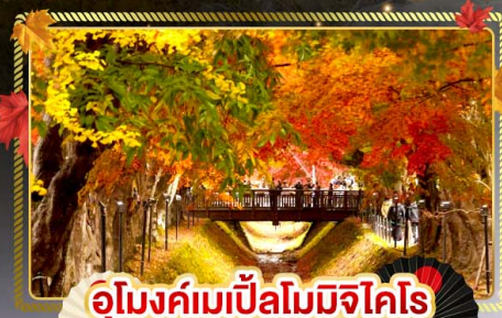
อุโมงค์เมเปิ้ลโมมิจิโคโร