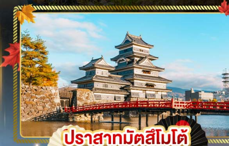
ปราสาทมิตสึโมโตะ