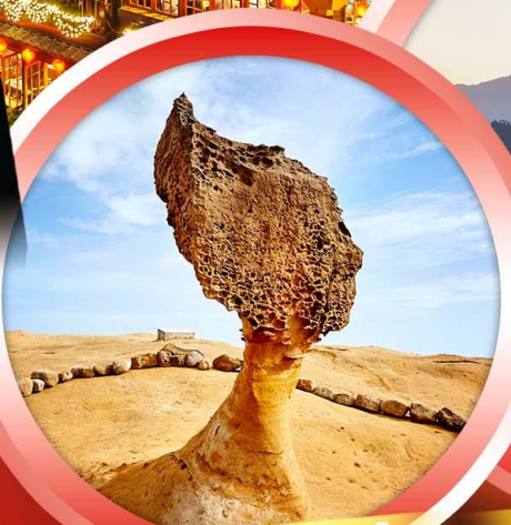
อุทยานแห่งชาติหยี่หลิว