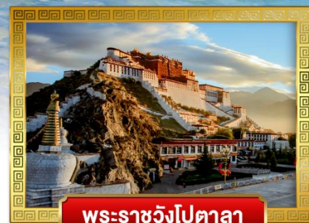
พระราชวังโปตาลา

เดินทางโดย: สายการบินบลูคิกเก็ตแอร์ (8L)