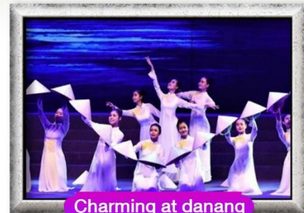
Charming at danang