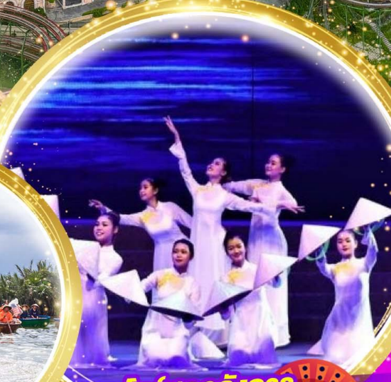
โชว์สุดอลังการ Charming at danang