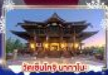
ชมเชิบุโทริ นกหวีด