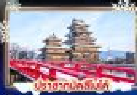
ปราสาทนาคสึโนะ