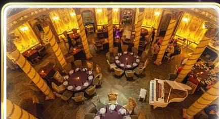
ทานอาหารสุดหรู ภัตตาคารTurandot