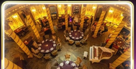
ทานอาหารสุดหรู ภัตตาคาร Turandot