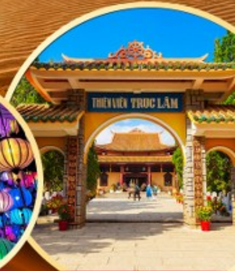
วัดตักลัม